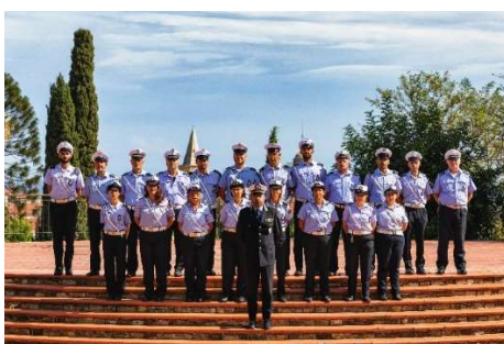
Foto di gruppo del Comando di Polizia Municipale (settembre 2020)

Quello di essere tra la gente ed a disposizione di tutti, secondo gli indirizzi dettati dall'Amministrazione, è il nostro lavoro. Continueremo a farlo con dedizione e passione, con impegno e attenzione, consapevoli della fortuna che abbiamo a svolgere un servizio il più possibile dedicato alla comunità alassina, formata dai residenti ma anche dai tanti turisti che speriamo possano tornare presto ad affollare le vie e le spiagge della nostra straordinaria città. Noi saremo sempre qua, come ci piace dire, al servizio di Alassio.