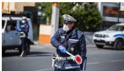
Pattuglia automontata in occasione di un posto di controllo