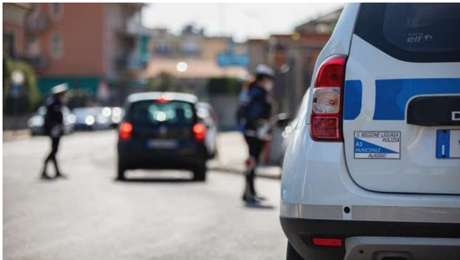
Controlli su strada relativi alla disciplina Covid-19